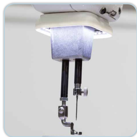
Anneau de lumière à DEL