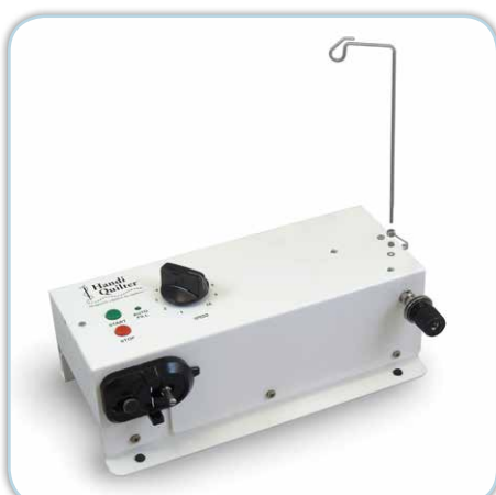
Bobinoir externe pour canette