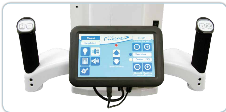
Élément de commande sur la tête de machine arrière, Manipulation simple grâce aux boutons dans les poignées