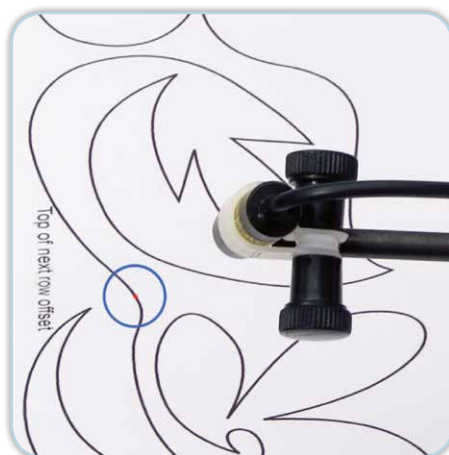
Laser en action