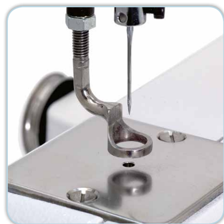
Pied sauteur robuste