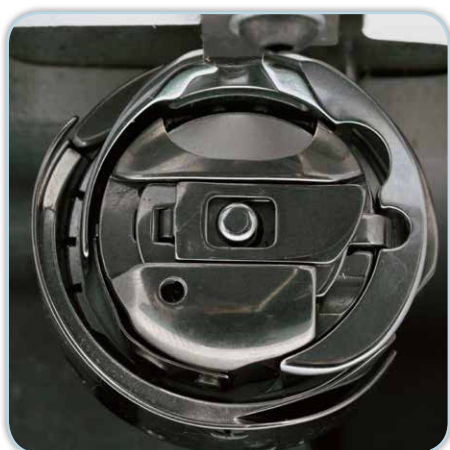
Crochet rotatif double robuste avec grande bobine de fil