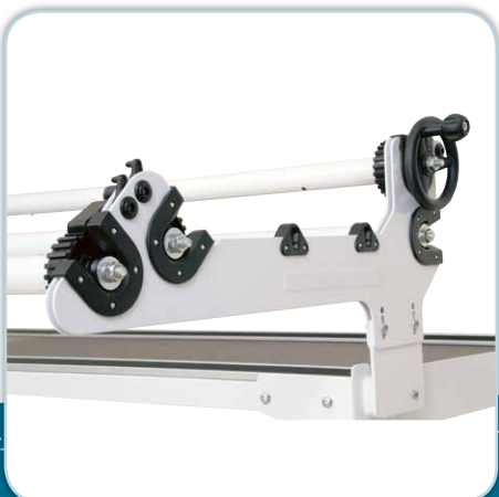
Cadre support des barres