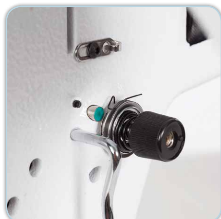
Réglage numérique de la tension du fil, breveté